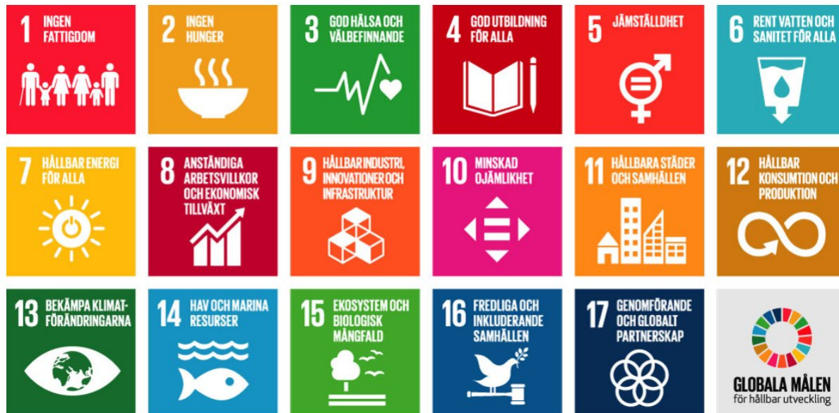
Bild 1 Agenda 2030, Målen för hållbar utveckling

Landskapsstrategin för Österbotten tar hänsyn till de ovan nämnda målen och bidrar till att uppnå dem. Strategin beaktar också EU:s politiska mål för utveckling av regionerna, regionala strategier inom olika förvaltningsområden och övriga program som berör landskapet.